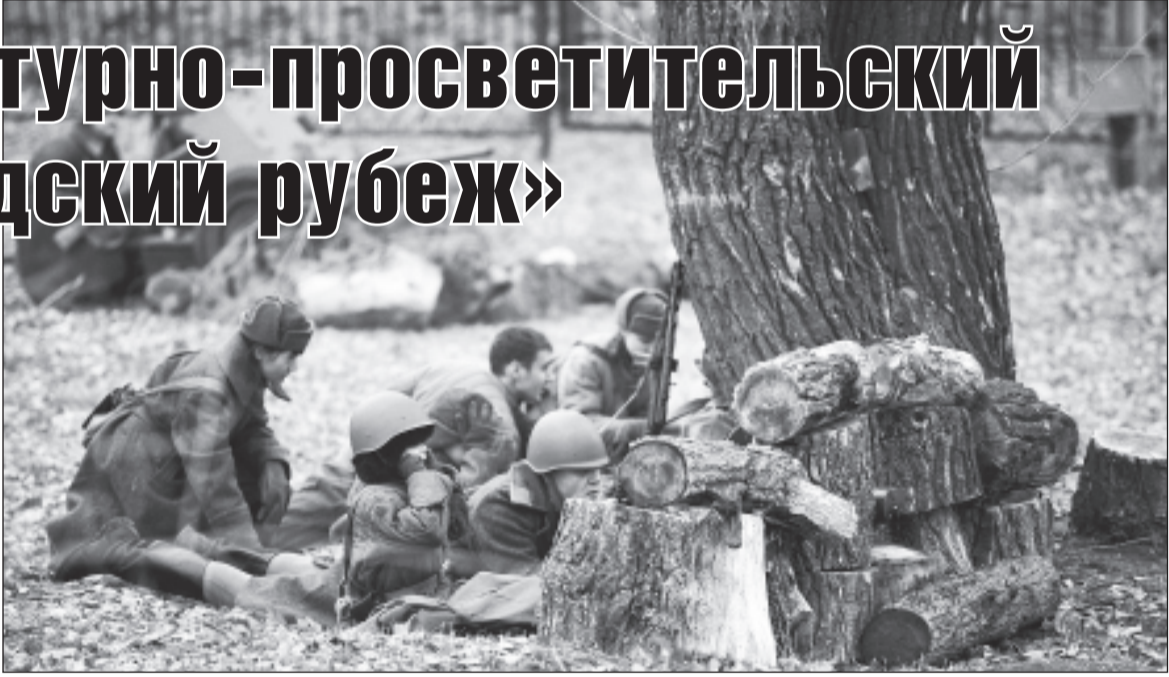
В программу «Сталинградского рубежа» также входила военно-историческая реконструкция