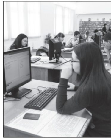
... и тестировали на профпригодность. И не только