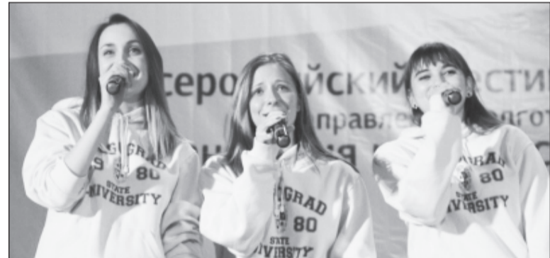
Первокурсники демонстрировали вокальные таланты