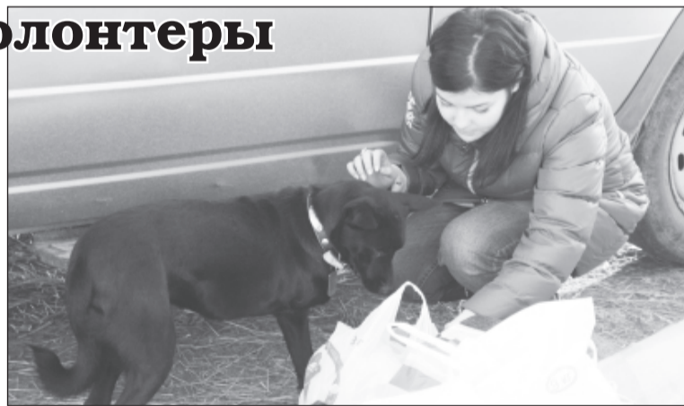
В приюте «Дино»

– Мы уже давно оказываем помощь приюту «Дино», регулярно с ним сотрудничаем, всегда реагируем на его просьбы. Кроме сбора лекарств, кормов и утеплителей, волонтеры еще занимаются уборкой территорий приюта и вольеров. С каждым годом наша помощь животным проходит все успешнее и успешнее, все больше подключается студентов. К нашему «Прорыву» в этом году присоединились студен-