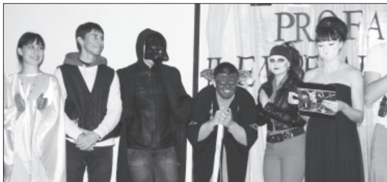
«Prof.Актив» – это весело, здорово, познавательно!