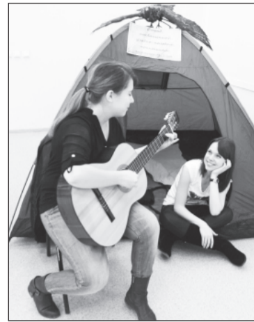
... рассказывали о студенческой жизни...