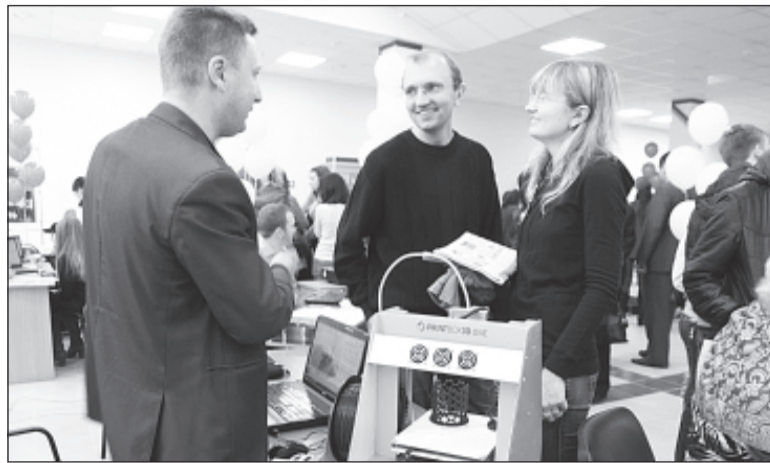
На Фестивале науки в ВолГУ абитуриентов познакомили с разработками ученых университета, ...

Здание Научной библиотеки ВолГУ по-настоящему оживило – уже к девяти часам ко входу в библиотеку начали подтягиваться первые любопытные абитуриенты. Еще бы! Ведь в этом году в нашем университете проходил III Фестиваль науки. Разнообразие интерактивных выставок и экспозиций по-настоящему захватывало и удивляло: совсем рядом располагалась выставка растений и презентация «Школы молодого политика», выставка «Книга как документ» и презентация «Поэтом можешь ты не быть, но бухгалтер ты знать обязан». Лазерное шоу, более 80 выставок, экспозиций, мастер-классов и семинаров – все это было представлено на Фестивале науки. Самые любознательные абитуриенты прошли и профориентационное тестирование, посетили интерактивную площадку