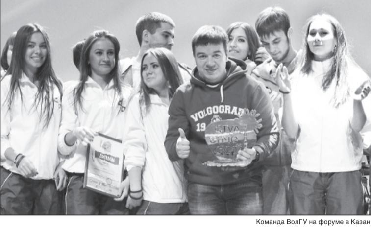
Команда ВолГУ на форуме в Казани

Команда Волгоградского государственного университета стала победителем Всероссийского молодежного форума «Студенческий марафон», который прошел в Казани с 22 по 26 октября. Участие в мероприятии приняли более 300 студентов из 25 вузов России.